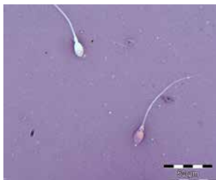
FIGUR 2: Spermievitalitet. Spermier farget med eosin-nigrosin fargeløsning. Rød spermie klassifiseres som død, hvit som levende.

Progressiv motilitet har tidligere vært inndelt i rask og langsom (5). De to kategoriene ble slått sammen i 2010-manualen fordi enkelte mente det var vanskelig å vurdere de raskt progressive nøyaktig og reproducerbart (6). Det er fremdeles uenighet i fagmiljøene om betydningen